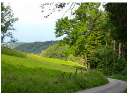
(4) Zwischen Neugrüt und der Verzweigung Tobelstrasse Richtung Schauenberg

Nach der Rast wählen wir einen anderen Weg retour nach Elgg. Wir nehmen den Weg Richtung Neugrüt und am Waldrand folgen (4) wir dem Wegweiser Richtung Schauenberg. Nach 1,2 km sind wir auf der Anhöhe Tannenweid, wo sich auch ein Parkplatz befindet.