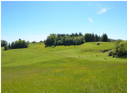
(1) Blick nach Hüttstal

Wir starten in Elgg und nehmen Weg entlang des Schlossbach hinauf zum Schloss Elgg. Von hier überqueren wir die Strasse und wählen den Weg Richtung Burghof, von dort entlang des Waldrandes bis wir links nach unten Richtung Sennhof abbiegen können. Nun gehen wir immer gerade aus bis nach Heurüti. In Heurüti wählen wir den Weg, vorbei am Stall der Familie Büchi, aufwärts in den Wald und dann links halten, rund 1km dem Weg folgen bis wir in Geretswil ankommen. In Geretswil folgen wir der „Hauptstrasse“ geradeaus und in der Kurve nehmen wir nun den Weg rechterhand, der uns aufwärts zum Bauernhof Hüttstal (1) führt.