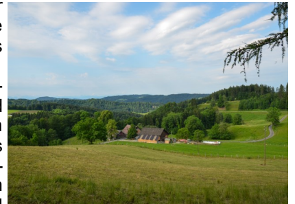
(3) Blick auf die Alpwirtschaft Schnurrberg

Nun folgen wir der Strasse Richtung Schnurrberg, biegen dann aber wieder links ab und folgen der Strasse immer gerade aus. Nach zirka 600m zeigt der Wanderwegweiser (2) uns den Weg Richtung Schnurrberg. Der Wanderweg ausgeschildert und wir folgen für 1,2 km dem Weg Richtung Schnurrberg. Der Weg wird zum schmalen, etwas steilen Waldpfad, der uns abwärts führt. Ich empfehle gutes Schuhwerk. Unten angekommen den Weidedurchgang nehmen und über die Weide dem Wanderweg folgen. Während der Sommermonate könnten Kühe auf der Weide sein. Schon bald sehen wir auch schon die Alpwirtschaft. (3). . Öffnungszeiten und Informationen unter www.schnurrberg.ch abrufbar.