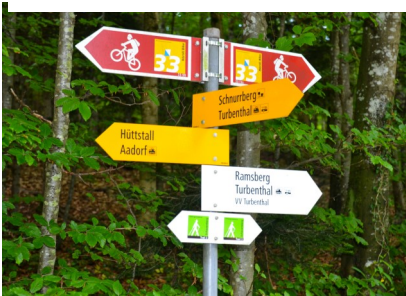
(2) Wegweiser Richtung Schnurrberg