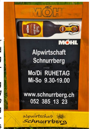
Unter www.schnurrberg.ch sind alle Informationen abrufbar

Wir wählen den Weg durch's Farenbachtobel bis nach Elgg und beschliessen unsere Tour.