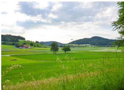
Blick Richtung Ettenhausen

Elgg, wir beginnen am Parkplatz beim Schwimmbad. Von hier folgen wir dem Weg, vorbei am Grillplatz entlang des Waldrandes. Wir überqueren die Strasse und gehen Richtung Tiefenau. Die Strasse führt uns nach Iltishausen, wo