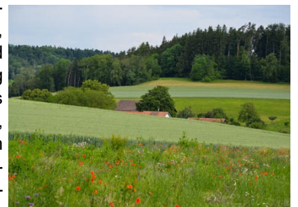
Blick iRichtung Sennhof von Heurüti kommend

wir gleich nach der Brücke rechts zwischen der Schlosserei und dem Unterstand dieser Strasse folgen. Der Weg führt nun entlang des Tobelbaches durch's Stosstobel, immer leicht aufwärts. Nach zirka 1,3 km sind wir an einer Kreuzung, wo wir rechts Richtung Stoos abbiegen. Der Weg führt oberhalb des Gehöftes Stoss entlang, wir biegen rechts ab, zwischen Haus und Stall durch abwärts. Am Waldrand treffen sie auf das Wildschweinge- wöhnungsgatter. Wenn sie Glück haben, können sie hier die Schweinchen beim Wühlen beobachten. Wir folgen nun immer der Um-