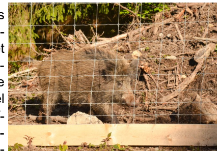
Mit etwas Glück können sie die Wildschweine beobachten

Der Weg führt nun immer geradeaus über's Feld, linkerhand sehen sie den Heurütiweiher, der unter Naturschutz steht. Er bietet verschiedenen Amphibien und Enten ein schönes Zuhause. In Sennhof überqueren wir die Strasse und biegen gleich nach der Ortstafel wieder rechts ab. Der Wiesenweg führt aufwärts bis zum Waldrand. Oben biegen wir wieder rechts ab und folgen nun dem Weg Richtung Schloss. Im kleinen Weiler Burghof folgen wir dem Trampelpfad, welcher am Brunnen vorbei geradewegs zu Schloss führt. Das Schloss Elgg ist privat und kann daher