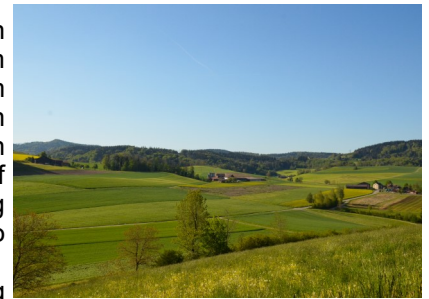
Ausblick nach Jakobstal

Vom Parkplatz (Wolfsweid) nehmen wir den Waldweg Birchholzstrasse und folgen dem Weg immer gerade aus. Nach rund 1,2 km endet die Birchholzstrasse und wir biegen rechts in die Pfannenstilstrasse ein. Nach 200m links und dann dem Strassenverlauf folgen. Nach 500m wieder links in Richtung