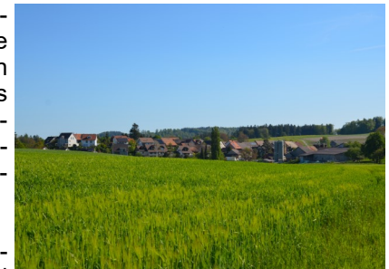
Zurück nach Dickbuch

Tipp: Wandern Sie von Elgg aus, brauchen Sie ab Ausgangs Dorf bis zum Parkplatz (Anfangsort) Wolfsweid rund 40 min (2,2 km). Folgen Sie einfach dem Wanderwegweiser Richtung Dickbuch.