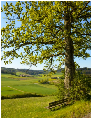
Die Bank zum Verweilen

Vom Restaurant Linde gehen wir nun ein Stück auf der Hauptstrasse Richtung Fältsch. Etwa 200m ausserhalb des Dorfes biegen wir rechts ab und folgen nun immer dem Weg gerade aus. Dieser führt uns am