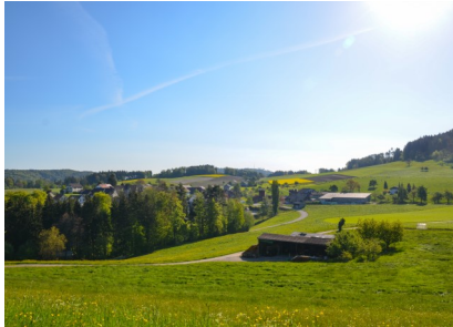
Blick nach Dickbuch

Dickbuch ist nicht mit den öffentlichen Verkehrsmittel erreichbar. Von Elgg führen verschiedene Wege zum Startpunkt der Wanderung. Mit dem Auto fährt man die „Halde“ hinauf. Am Waldrand gleich rechts gibt es etwas Platz, wo das Auto parkiert werden kann. Oder sie wandern von Elgg zum Ausgangsort. Der Weg Richtung Dickbuch ist beginnt ab dem „Risibrünneli“ mit Wanderwegtafeln ausgemerkelt.