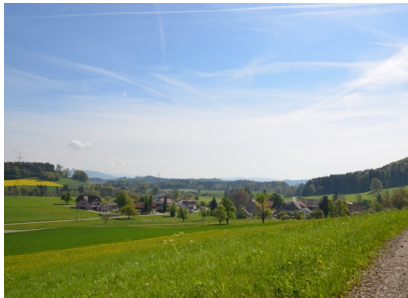
Blick nach Hofstetten

Tour 3 beginnt in Hofstetten, am Besten nutzt man das Postauto von Elgg her bis zur Haltestelle Hofstetten Dorf. Von hier geht's dann zu Fuss los. Wir folgen der Strasse Richtung Schlatt und biegen dann rechts ab in die Schäferstrasse. Nach der Weide links der Strasse aufwärts Richtung Wald. Rechts führt sie entlang des Waldrandes und bietet einen herrlichen Blick auf das Dorf Hofstetten.