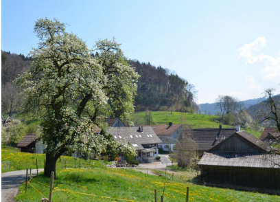
Blick nach Wenzikon

Dem Wanderweg folgen Richtung Sonntal bis Wenzikon. Auf der Strasse geht es weiter durch Wenzikon und nach dem Brunnen rechts dem Weg nehmen. Nach 450 m folgen wir dem Pfad links hinauf und wandern durch ein kleines Seitental bis der Pfad auf die Gugenhardstrasse einmündet. Nun folgen wir diesem Weg oberhalb des Weilers Steig bis zur Kreuzung, wieder rechts Richtung Steig. Wir folgen dem Wegweiser Richtung Hofstetten bis der Weg auf die Hauptstrasse mündet; Achtung hier gilt Tempo 80 für den Verkehr, also Vorsicht. Wir folgen dem Wegweiser Sennhof. Die Route