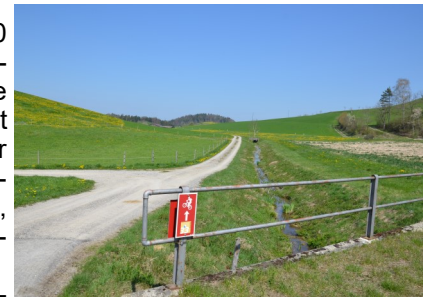
Entlang des Baches Richtung Jakobstal

Wir überqueren die Hauptstrasse und folgen dem Wanderweg linkerhand des Baches Richtung Fältsch (Jakobstal).