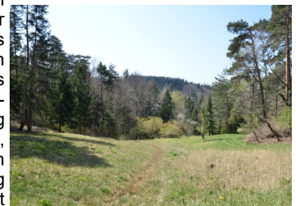
Lauschiges Plätzchen zum Verweilen

Dem Wanderweg folgen Richtung Sonntal bis Wenzikon. Auf der Strasse geht es weiter durch Wenzikon und nach dem Brunnen rechts dem Weg nehmen. Nach 450 m folgen wir dem Pfad links hinauf und wandern durch ein kleines Seitental bis der Pfad auf die Gugenhardstrasse einmündet. Nun folgen wir diesem Weg oberhalb des Weilers Steig bis zur Kreuzung, wieder rechts Richtung Steig. Wir folgen dem Wegweiser Richtung Hofstetten bis der Weg auf die Hauptstrasse mündet; Achtung hier gilt Tempo 80 für den Verkehr, also Vorsicht. Wir folgen dem Wegweiser Sennhof. Die Route