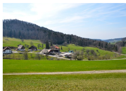
Der Weiler Scheunberg, im Hintergrund Schlatt

Unten angekommen steht links eine Picknick-Aussichtsbank zum Verweilen. Ein paar Meter weiter gehen wir rechts und nun immer gerade aus. Der Weg führt auf 1,8 km mit leichter, stetiger Steigung vom „Luegeten“ über den „Säuruggen“.