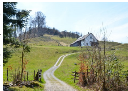
Blick zum Schauenberg

In Ortsmitte folgt man dem Wegweiser Richtung Elgg. Der Weg führt ein paar Meter den Hang hinauf, oben angekommen hat man einen herrlichen Ausblick auf den Weiler. In der Ferne ist die Kirche von Schlatt zu erkennen. Vorbei am Grenzstein von 1781 folgt man dem Weg, kommt man rechter Hand an einem Wanderwegzeichen vorbei. Hier beginnt der etwas steile 300 m lange Abstieg Richtung Hofstetten.