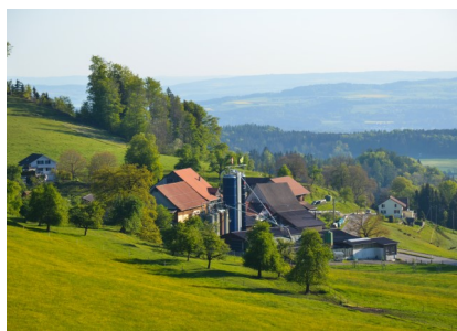
Blick nach Geretswil

Geretswil, ein kleiner Weiler unterhalb des Schauenberg, hier beginnt die knapp zweistündige Wanderung. Der Startpunkt der Wanderung befindet sich auf dem Parkplatz „Tannenweide“ oberhalb Geretswil. Von hier hat man einen herrlichen Weitblick über den Thurgau. Rechterhand nimmt man den Weg, in Richtung Schauenberg, vorbei an der Raststelle der Skifreunde Huggenberg, wo auch gegrillt werden kann.