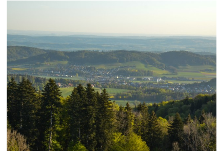
Der Blick nach Elgg