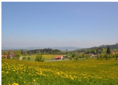
Blick nach Huggenberg

Huggenberg, in diesem kleinen Dorf im östlichsten Teil der Gemeinde wohnen aktuell rund 100 Einwohner; - hier beginnt die erste Tour. Kommt man mit dem Auto vom Rüetschberg her (Verbindung Ettenhausen – Seelmatten), befindet sich der öffentliche Parkplatz auf der rechten Seite. Mit öffentlichen Verkehrsmitteln ist Huggenberg nicht erreichbar. Von hier aus führt der Weg aufwärts Richtung Dorf. In Huggenberg links und gleich wieder rechts halten, vorbei an der „Pilzkontrolle“ Nun folgen wir dem Weg, vorbei am Buchenhof und halten uns an der nächsten Kreuzung links.