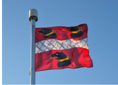
Die Elger Bären wehen auf dem Hausberg