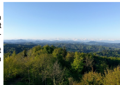
Blick in die Alpen vom Schauenberg

Unter https://www.swisswebcams.ch gelangt man zur Webcam, welche schon mal einen Ausblick vom Elgger „Hausberg“ zeigt.