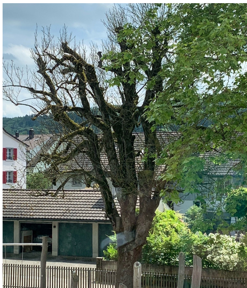
Die Rosskastanie war krank und musste aus Sicherheitsgründen gefällt werden. Als Ersatz wurde eine Edelkastanie gesetzt.