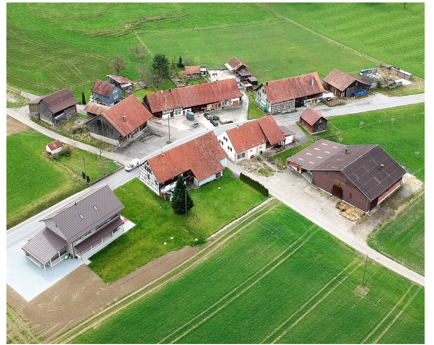
Der Gemeinderat bewilligt die Durchführung einer Motocrossveranstaltung am 14. September in Mittelschneit.