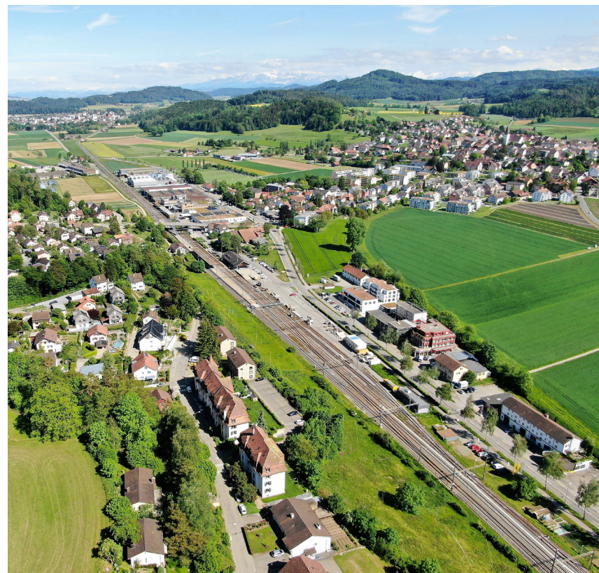
Die Polizeiverordnung der Gemeinde Elgg ist mittlerweile über 20 Jahre alt und wird nun überarbeitet.