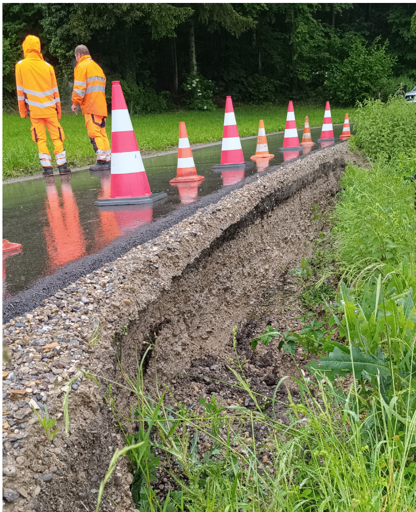
Die starken Regenfälle im Frühling führten zum Böschungsrutsch.

Die starken Regenfälle im Frühling führten am 2. Juni zu einem Böschungsrutsch an der Weidhofstrasse. Als Sofortmassnahme wurde die Strasse abgesperrt und bergseitig eine provisorische Kiespiste eingerichtet. Zur Vermeidung weiterer Nässeinwirkungen, wurde ein Mörtelbord angelegt und die Böschung mit Plastik abgedeckt. Gleichzeitig wurde ein Sanierungsvorschlag ausgearbeitet. Dieser sieht einen Ribbert-Verbau vor. Nebst dem Verbau wird bergseitig eine zusätzliche Entwässerung erstellt, welche künftig das Hangwasser vom Überfließen der Strasse abhalten soll. Der Gemeinderat genehmigte an seiner Sitzung vom 26. Juni das entsprechende Projekt sowie die anfallenden Kosten von 50'000 Franken. Die Bauarbeiten werden voraussichtlich im August stattfinden.